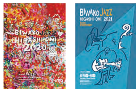
第12回 2020年4月25日(土)・26日(日) 第13回 2021年6月5日(土)・6日(日) →9月19日(日)・20日(月)に延期 新型コロナの影響により開催中止

ジャズフェスとしての内容の充実だけでなく、若い世代に向けた「ストリートチャレンジ」や、地域資源の充実を目指す「パンフェスティバル」など新しい試みにも挑戦しました。